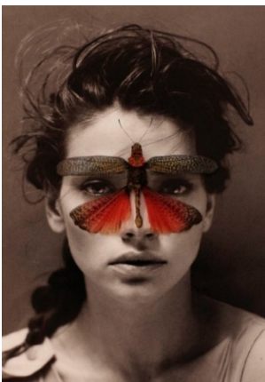
Photo & Contemporary Giovanni Gastel, Beauty , Margarita, 2012

Ein Fokus auf Giovanni Gastel und die Künstler:innen, mit denen er im Laufe der dreißigjährigen Tätigkeit der Galerie zusammengearbeitet hat.