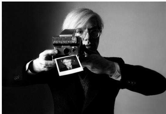
Colombo's Gallery, Oliviero Toscani, Senza Titolo 1971-1975