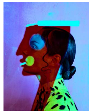
ANTON CORBIJN, Neneh Cherry, London 1992, © Anton Corbijn, courtesy Jaeger Art | Rune Guneriussen, Evolution, 2024 © Rune Guneriussen, courtesy MARCOROSSO ARTECONTEMPORANEA | KRISTIAN SCHULLER, Karmen 1, 2021, © Kristian Schuller, courtesy Jaeger Art