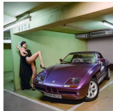
06 Helmut Newton BMW, Monaco 1991, (BMW Z1) © Helmut Newton Foundation