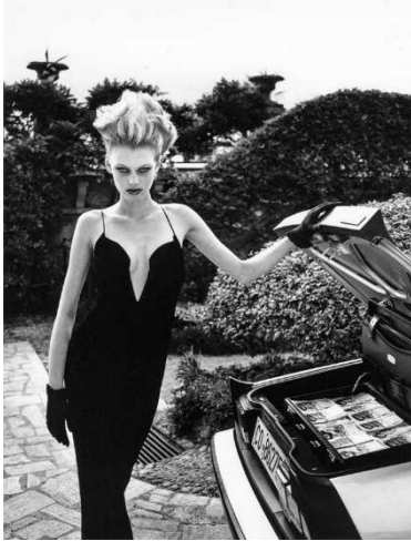
07 Helmut Newton Italian Vogue , Lake Como 1996 (Alfa Romeo Spider 2.0)