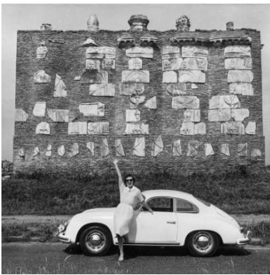
01 Helmut Newton June, Via Appia Antica, Rome 1956, (Porsche 356)

Für Pressematerial und Interviews kontaktieren Sie bitte: Emanuele Bedetti, Head of Press Communications - FuoriConcorso - Larusmiani Tel.: +39 351 8922000 | Email: press@fuoriconcorso.org