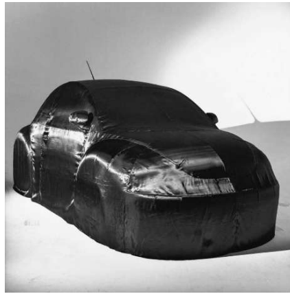
08 Helmut Newton New Beetle, Milan 1999 (VW Beetle)