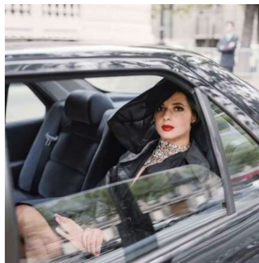
05 Helmut Newton Isabella Rossellini, Paris 1990 © Helmut Newton Foundation