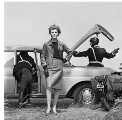
03 Helmut Newton At the French-Belgian Border, French Vogue , 1962, (Mercedes Benz 190c)