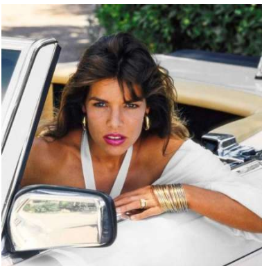
04 Helmut Newton Princess Caroline of Monaco Monaco 1985, (Mercedes-Benz 280 SL) © Helmut Newton Foundation