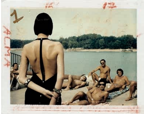
3. Helmut Newton Amica , Milan 1982 (Polacolor)