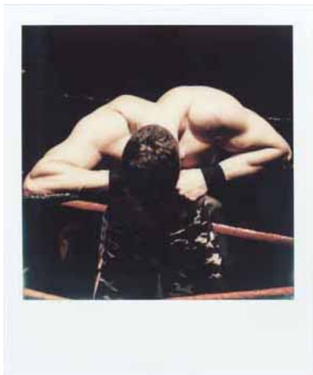
7. Pola Sieverding Valet #11 , 2014 (Integralfilm / Polaroid)