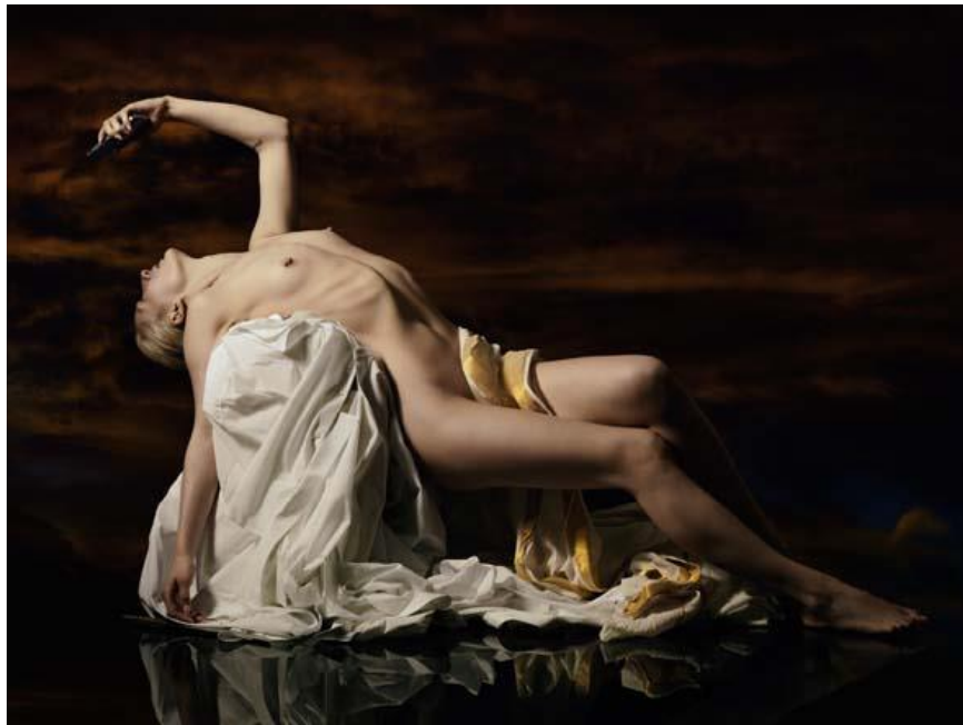
L'age d'or, Berlin 2023