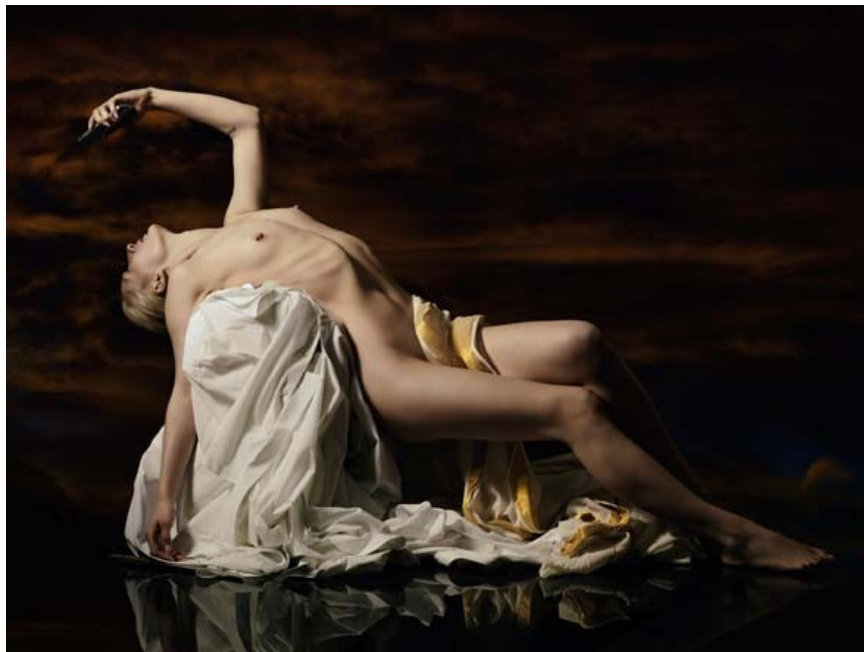
L'age d'or, Berlin 2023