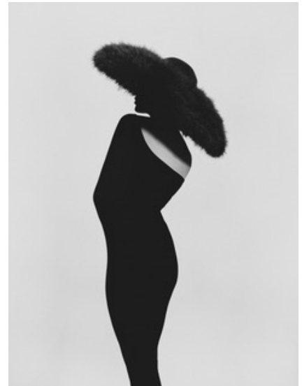
FRE, 2021 (links) | MYSTIC, 2022 (mittig) | SVELTE, 2023 (rechts), alle: © Bastiaan Woudt, courtesy JAEGER ART, Berlin

JAEGER ART freut sich, die erste Einzelausstellung des renommierten Fotokünstlers Bastiaan Woudt in Deutschland anzukündigen. Ab dem 14. September zeigt die Galerie unter dem Titel " Rhythm " verschiedene Werkgruppen, von denen einige noch nie zuvor öffentlich gezeigt worden sind.