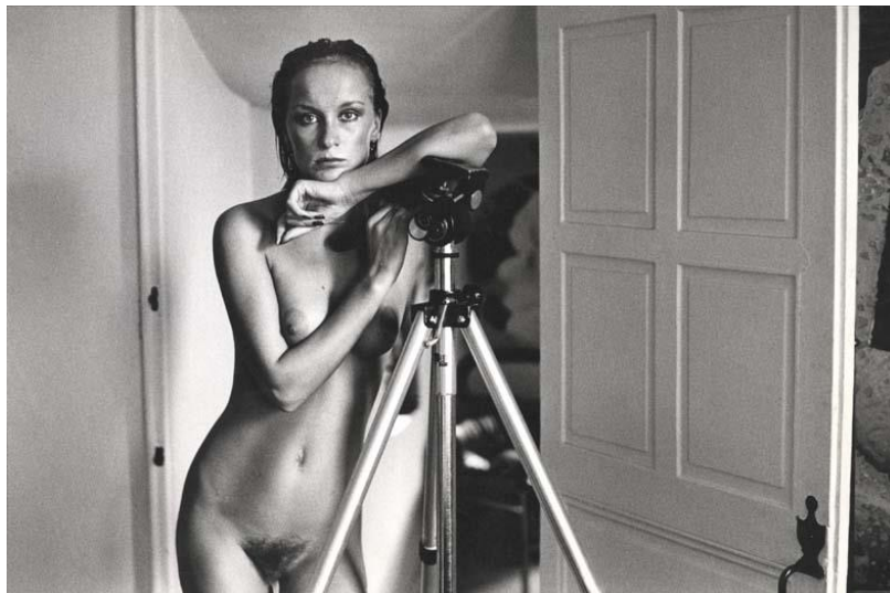
Alice Springs, Sirpa Lane, Paris 1972, copyright Helmut Newton Foundation

Auch wenn die meisten der Porträtierten zum kulturellen Jetset gehören, macht Alice Springs grundsätzlich keinen Unterschied zwischen den gesellschaftlichen Schichten. Ihren Kamerablick auf die Menschen konzentriert sie meist auf deren Gesichter; zuweilen fasst sie sie im engen Bildausschnitt als Brust- oder Dreiviertelporträt. Die Porträtierten schauen neugierig, offen und direkt in ihre Kleinbildkamera. Nur wenige Studioporträts sind darunter, die Mehrzahl entstand vielmehr – meist bei natürlichem Licht – im öffentlichen Raum sowie vor oder in den Wohnungen der Protagonisten. So begegnen uns eitle Posen oder ein natürliches Selbstbewusstsein ebenso wie schüchterne Blicke. Die Bildnisse, im Auftrag von Zeitschriften ebenso wie aus freiem Antrieb entstanden, werden zu visuellen Kommentaren, zu Interpretationen der Dargestellten. Alice Springs lässt jedem und jeder Porträtierten seine oder ihre Individualität. Dabei gelingt es ihr immer wieder, dem allgemeingültigen und bekannten Bild ein möglichst klischeefreies, neues und ungewöhnliches Abbild hinzuzufügen. Möglicherweise hilft ihr die tiefe Kenntnis des Schauspiels, gleichzeitig auf und hinter die Fassade des Menschlichen zu schauen.