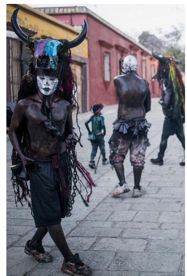
Woman in Japan (links) | Buchtitel „A Series of Glances“ (mittig) | Masks in Mexico 1 (rechts)

Parallel zur internationalen Ausstellungstour des britischen Ausnahmekünstlers Andy Summers erscheint diesen Monat sein lang erwartetes, neues Buch “A Series of Glances” im teNeues Verlag .