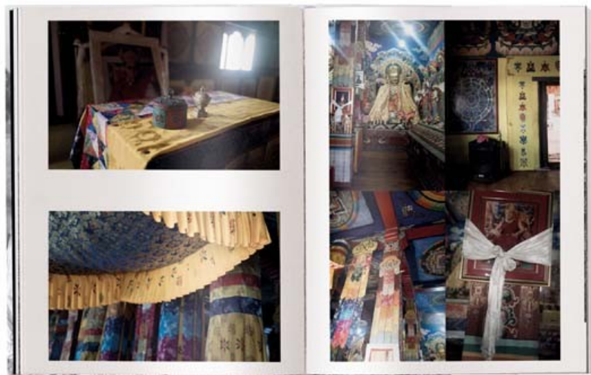
Blick ins Buch "A Series of Glances" von Andy Summers

Auf Summers zumeist in schwarz-weiß gehaltenen Fotografien begegnen wir Personen, die mal in der Musik versunken, mal in einer religiösen Festivität aufzugehen scheinen; auf anderen Bildern tauchen wir zusammen mit dem Fotografen in atemberaubende Kulturstätten oder kontemplative Szenerien ein, die sich, wie auch Summers Musik, dem abwechslungsreichen Rhythmus des Lebens anpassen. Dabei gelingt es ihm stets, besondere Momente auf einzigartige Weise einzufangen. "A Series of Glances" wird somit zu Andy Summers vielleicht persönlichstem Werk überhaupt.