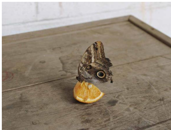
Alec Soth, Philadelphia, Pennsylvania 2020