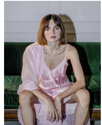
Myriam Boulos, Sexual Fantasies, 2020