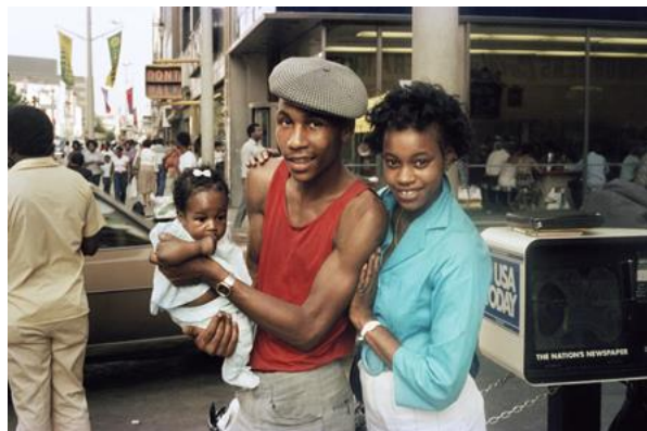
Joy Riding, Flatbush, Brooklyn 1981 (links) | Young Love, Downtown Brooklyn NY, 1983 (rechts)

Der amerikanische Fotograf Jamel Shabazz ist in Brooklyn, New York geboren und aufgewachsen. Bereits im Alter von 15 Jahren nahm er seine erste Kamera zur Hand; dies war nicht nur der Auftakt seiner fotografischen Reise, sondern auch das erste Kapitel seines berühmten „Visual Diary“. Seit den frühen 1980er-Jahren hat Shabazz die Energie des New Yorker Straßenlebens eingefangen und gleichzeitig ikonische Bilder der Community, deren Stil und Lebensart geschaffen. Die kommende Einzelausstellung Photographs by Jamel Shabazz: 1980–1989 versammelt größtenteils noch nie gezeigte Arbeiten aus dieser Zeit.