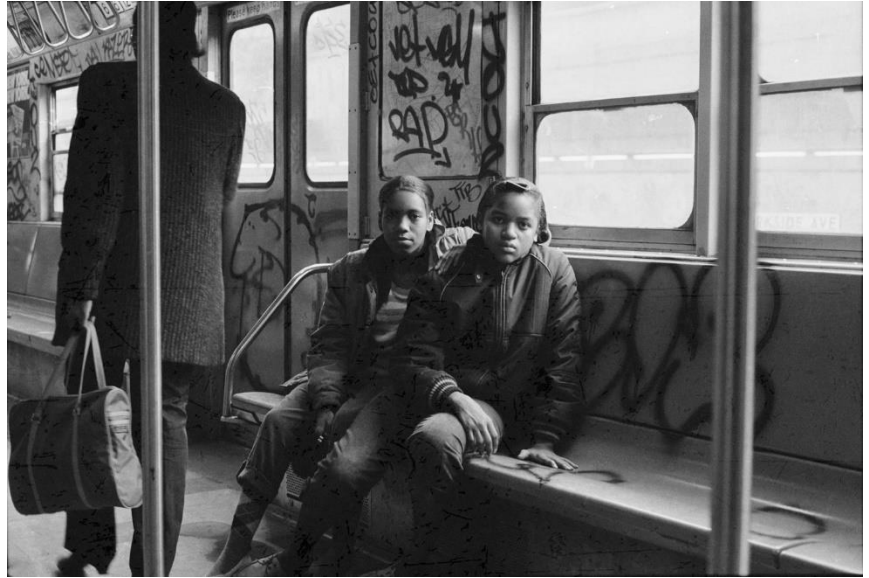
The Observer, NY, 1985 (links) | Friends, Bed Stuy, Brooklyn, NYC, 1981 (rechts)

Über die Galerie Bene Taschen: Die 2011 in Köln gegründete Galerie Bene Taschen vertritt einige der international führenden Künstler der zeitgenössischen Fotografie und Malerei. Die Galerie hat es sich zur Aufgabe gemacht, ihre internationalen Künstler durch die regelmäßige Teilnahme an bedeutenden Kunstmessen wie der Paris Photo und der Art Cologne sowie einem umfangreichen Ausstellungsprogramm zu fördern. Im Jahr 2011 debütierte die Galerie Bene Taschen mit dem LA-Fotografen Gregory Bojorquez ; ab 2013 begann die Zusammenarbeit mit Joseph Rodriguez aus New York. Im Jahr 2014 trat der gefeierte Berliner Fotograf Miron Zownir dem Galerieprogramm bei. 2015 kamen die amerikanischen Fotografen Jamel Shabazz und Arlene Gottfried aus New York hinzu. Seit Herbst 2017 freut sich die Galerie über die Vertretung des in New York lebenden Fotografen Jeff Mermelstein und der deutschen Malerin Charlotte Trossbach und arbeitet seit Herbst/Winter 2019 mit den renommierten Fotografen Sebastião Salgado und Larry Fink zusammen.