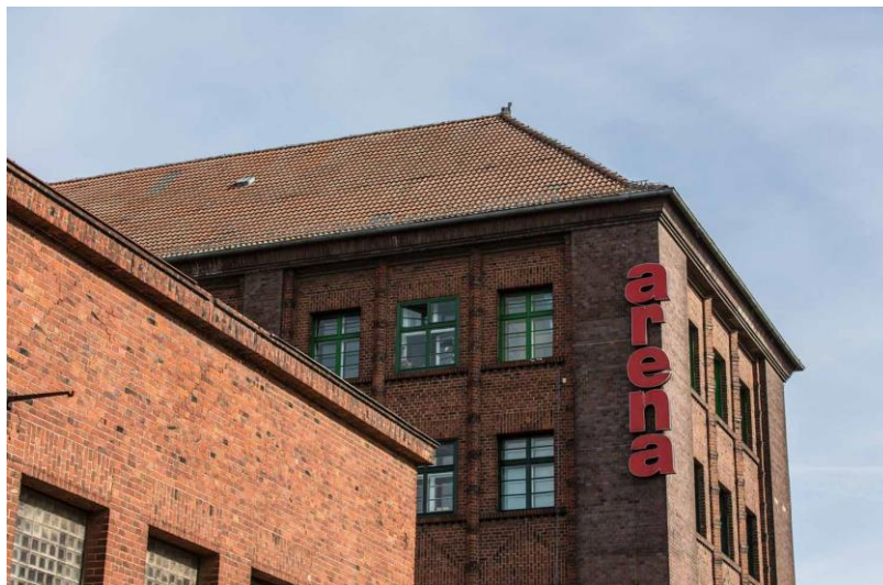
Arena Berlin, Außenansicht, 2022, © Markus Nass, courtesy BERLIN PHOTO WEEK

Main Location: Arena Berlin, Eichenstraße 4, 12435 Berlin