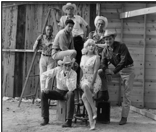
John Huston, Marilyn Monroe, Clark Gable, Montgomery Clift, Eli Wallach and Arthur Miller on the set of "The Misfits", Reno, Nevada, USA, 1960

Die weltweit renommierte Fotoagentur wurde von vier Fotografen gebildet – Robert Capa, Henri Cartier-Bresson, George Rodger und David "Chim" Seymour. Sie gründeten Magnum Photos 1947 im Penthouse Restaurant des MoMA in NY, mit dem Wunsch ihre Unabhängigkeit sowohl als Menschen als auch als Fotografen zu reflektieren. Magnum steht auch heute noch für die eigenwillige Mischung aus Reporter und Künstler – die nicht nur betont, was man sieht, sondern auch die Art und Weise wie man es sieht und wie man es vermittelt.