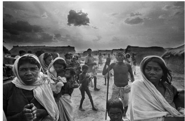
1956. Italy. Love-birds in Rome (links) | INDIA, Bihar 1967. Famine and smallpox epidemic. Villagers come out of their huts to beg for food (rechts)