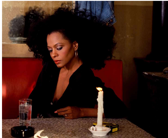
Arnold Schwarzenegger, Beverly Hills 1985 (links) | Diana Ross, Los Angeles 1996 (rechts)

Greg Gorman (*1949, Kansas City, Missouri, USA) wollte ursprünglich Fotojournalist werden. Seine wahre Berufung jedoch fand er 1968, als er Jimi Hendrix während eines Konzerts in Kansas City fotografierte. Das Bild wurde zum Auftakt seiner nunmehr 50-jährigen Karriere als Starfotograf. Nach seinem Abschluss mit dem Master of Fine Arts in Jahr 1972 begann Gorman, Schauspieler und Musiker zu fotografieren. So wurde er zur Ikone, ebenso wie die von ihm Porträtierten. Gorman selbst sagte einmal über sich: „Ich würde nie etwas fotografieren, das mir nicht widersprechen kann.“ Viele seiner fesselnden Schwarz-Weiß-Bilder erschienen auf Kinoplakaten oder auch auf CD-Covern und zierten die Seiten von Magazinen wie Life , Newsweek , Vogue und Rolling Stone . Mehr als ein Dutzend Mal war ein Gorman-Porträt auf dem Cover von Andy Warhols Interview Magazine zu sehen.