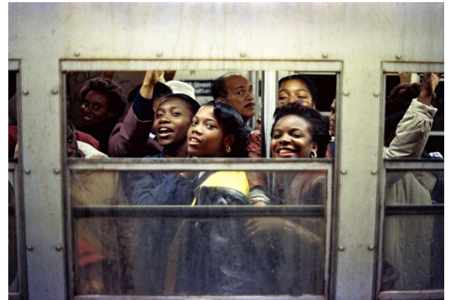
Jamel Shabazz, Untitled, Spanish Harlem, NY 1980 (links) // Rush Hour , NYC 1988, beide Bilder: © Jamel Shabazz + Courtesy Galerie Bene Taschen

Nach der Ausstellung City Metro im Dezember 2018/Januar 2019 in der Kölner Galerie Bene Taschen erscheint am 8. Mai 2020 das gleichnamige Buch.