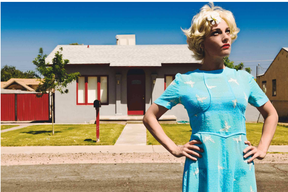
Eva Hassmann, Who is Brian, C-Print, 2012, © Eva Hassmann, Courtesy THE ART SCOUTS Galerie

Ort: THE ART SCOUTS Galerie Giesebrechtstraße 16, 10629 Berlin