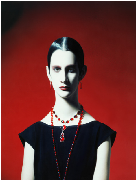
Toni Meneguzzo, Vogue, Gioiello, 1986, copyright Toni Meneguzzo

Meneguzzos erste Schau hatte er in London bereits 1975. In dieser Zeit begann seine enge und langjährige Zusammenarbeit mit der Vogue Condé Nast Group. Darüber hinaus war er verantwort-lich für viele große Modekampagnen, wie die für Jil Sander , Issey Miyake , Gianfranco Ferré oder auch für Guerlain , eines der ältesten Parfumhäuser der Welt. Es folgten unzählige internationale Ausstellungen und Beteiligungen an Foto-Biennalen, in denen seine Arbeiten zunehmend Anerkennung in der zeitgenössischen