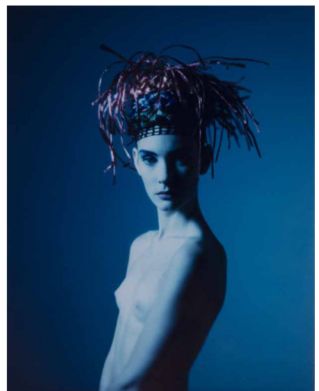
Toni Meneguzzo, Vogue, Pelle, 1986 (links) – L.A. Style, 1992 (mittig) – Vogue Gioiello, 1986 (rechts) alle Fotos: copyright Toni Meneguzzo

Anlässlich der Fashion Week Berlin eröffnet die GALERIE 206 im Departmentstore Quartier 206 am 29. Juni 2016 mit FRAMMENTI 20X25 erstmalig in Berlin eine Auswahl stilprägender Modefotografien des italienischen Künstlers Toni Meneguzzo .