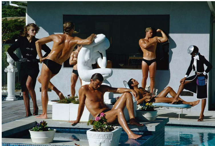
Helmut Newton, Stern, Los Angeles 1980

Am 28. Mai 2020 eröffnet die Berliner Helmut Newton Stiftung ihre neue Ausstellung „America 1970s/80s“ mit Werken von Evelyn Hofer, Sheila Metzner, Joel Meyerowitz und Helmut Newton .