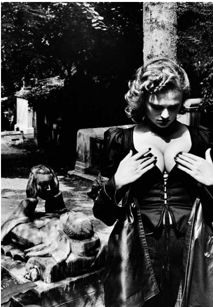
Helmut Newton, Fashion Yves Saint Laurent, Père Lachaise, Paris 1977, copyright Helmut Newton Estate