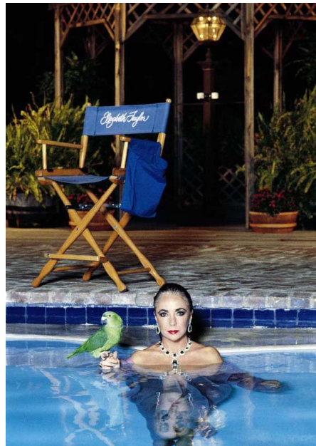
Helmut Newton, Elizabeth Taylor, Vanity Fair, Los Angeles, 1989