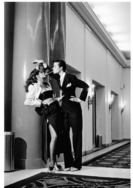
Helmut Newton, Fashion Yves Saint Laurent, French Vogue, Paris 1979, copyright Helmut Newton Estate

Ein legendäres Fotobuch, eine private Fotosammlung und drei ehemalige Assistenten: Das sind die Zutaten für die neue Ausstellung in der Helmut Newton Stiftung , die am 6. Juni 2019 eröffnet wird. 1999, vor 20 Jahren, veröffentlichte der TASCHEN-Verlag sein erstes monumentales Kunstbuch: Helmut Newton's SUMO . Es kam in einem ungewöhnlich großen Format von 70 x 50 cm auf den Markt, in einer hohen Auflage, alle vom Fotografen persönlich signiert, und wurde mit einem von Philippe Starck entworfenen Metallständer ausgeliefert. Etwas später wurde der von zahlreichen Prominenten signierte SUMO auf einer Charity-Auktion zum teuersten Buch des 20. Jahrhundert.