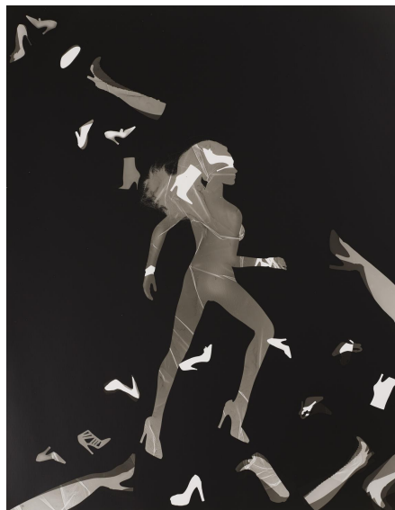
Mark Arbeit, Shoes #2, Homage to Helmut Newton, 2018