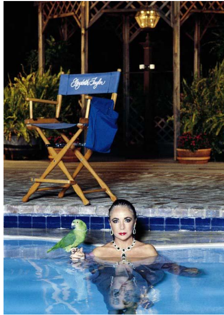
Helmut Newton, Elizabeth Taylor, Vanity Fair, Los Angeles, 1989