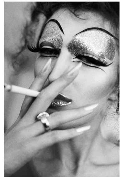
Just Loomis, Vinyl Eyes, Galliano, Paris 2004

Erstmals wird auch die exquisite private Fotosammlung von Helmut und June Newton öffentlich gezeigt, die sich seit kurzem als Depositum in der Helmut Newton Stiftung befindet. In „June's Room“ hängen – parallel zu SUMO und Three Boys from Pasadena – nun über 50 wertvolle Vintage Prints in der originalen Rahmung, darunter Porträts von August Sander, Brassai, Ralph Gibson, Mary Ellen Mark, Irving Penn oder George Hurrell, Aktbilder von Man Ray, Robert Mapplethorpe, Henri Cartier-Bresson, Frantisek Drtikol, Diane Arbus und Chris von Wangenheim, Modeaufnahmen von Horst P. Horst, George Hoyningen-Huene, Richard Avedon sowie Landschaften von Franco Fontana und Peter Beard – kurzum, eine Auswahl der bedeutendsten Fotografen des 20. Jahrhunderts.