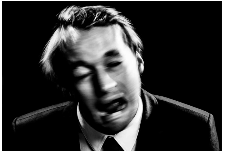
Hitchcock Jenny, 2018 (links) / Angry Young Man, 2017 (rechts), alle Bilder: copyright Katja Flint

Nach dem erfolgreichen Auftakt der Debutausstellung „Eins“ in der Kunsthalle Rostock, welche einen wahren Besucherrekord verbuchte, werden die emotionsgeladenen Fotografien der Wahlberlinerin Katja Flint ab dem 30. März in der Berliner Galerie Semjon Contemporary präsentiert.