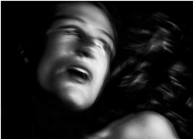
Photo Call: Freitag, 29. März 2019, 18.00 – 18.30 Uhr Eröffnung: Freitag, 29. März 2019, 19.00 – 21.00 Uhr Laufzeit: 30. März – 4. Mai 2019 Ort: Galerie Semjon Contemporary Berlin, Schröderstr. 1, 10115 Berlin