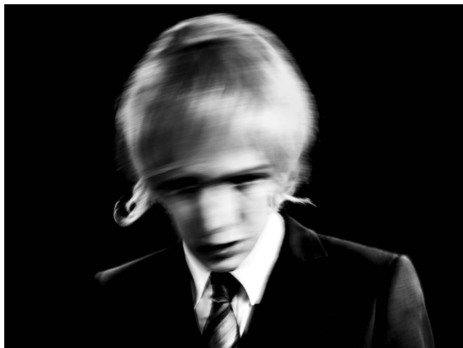
Sensual Selina, 2018 // Rockstar K, 2018

Flints selbst formuliertes künstlerisches Ziel ist es, in der Fotografie einen malerischen Effekt zu erzielen und gleichzeitig ins Innere des Menschen zu schauen. Das geschieht diskret und vorsichtig, mit großem Einfühlungsvermögen, nie aufdringlich oder gar desavouierend. So entsteht ein Theater der Emotionen, ein Ein-Personen-Stück, realisiert auf einer Miniaturbühne. Der emotionale Ausdruck in den Fotografien Katja Flints ist hierbei existenzieller und ursprünglicher als von anderen Porträts gewohnt; sie konfrontiert uns mit echtem Staunen und Verwirrtheit, mit Stolz oder Zerbrechlichkeit und brilliert in ihrer einzigartigen Visualisierung von Furcht und Verführung, von Euphorie oder Verzweiflung. Flints Fotografien wirken authentisch, mitunter so intensiv, dass sie verstören , und durch den schwarzen Bildraum und das exponierte Gesicht gleichzeitig auch theatralisch und so könnten wir, gleichsam zur eigenen Beruhigung, darin nur die Darstellung einer Emotion sehen. Doch tatsächlich steigt Katja Flint eine Stufe tiefer ins Unterbewusstsein, als die meisten Kollegen es tun, denn ihre fotografischen Bilder werden zu einem „echten“ Drama, das der Betrachter so schnell nicht vergisst . Der Fotografin gelingt es, Gefühle von innen nach außen zu kehren und sie so erkennbar und erlebbar zu machen.