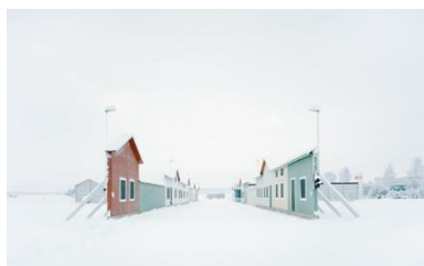
Gregor Sailer, Carson City VI / Vårgårda, Sweden, 2016, aus der Serie »The Potemkin Village«, Ed. 5 + 2 AP © Gregor Sailer / Courtesy: Kehrer Galerie