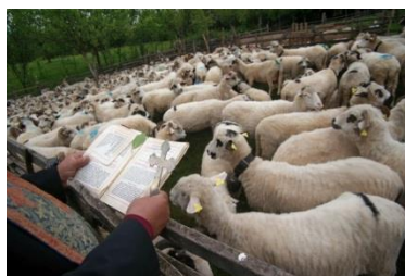
Remus Tiplea, Blessing of sheep, Camarzana 2016 © Remus Tiplea / Courtesy: Rumänisches Kulturinstitut Berlin