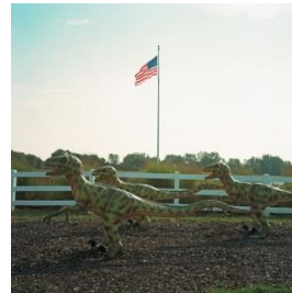
Josef Wolfgang Mayer, Animal Sculpture #21, USA 2017 ©Josef Wolfgang Mayer 2017 / Courtesy: Galerie Koschmieder