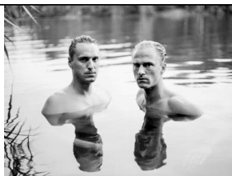
Charlott Cobler, Barnabas und Antonius, 2017