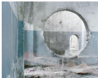
Andrej Pirrwitz, Zeigerlosigkeit, 2017 © Andrej Pirrwitz / Courtesy: Alte Feuerwache Projektraum