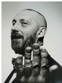
Jérôme Schlomoff, Georg Baselitz, 1989