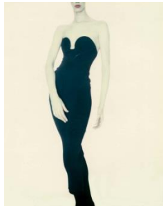
Paolo Roversi, Meg, Alaïa Dress, 1987