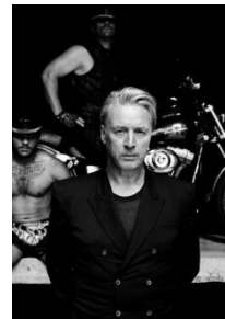
Sven Marquardt, o.T. (Hell), 2017 aus der Serie „Musiker“