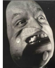
Nathan Lerner, Focused view for camera: Brown's Face, 1939, Print 1972