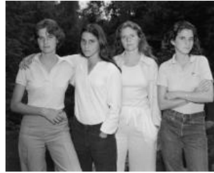
Nicholas Nixon, The Brown Sisters, 1975