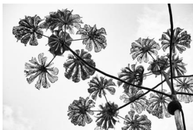
Ricardo de Vicq, Embauba, Januar 2008