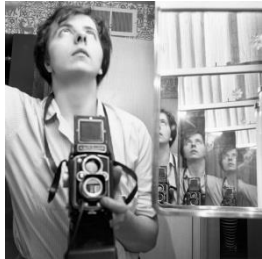
Vivian Maier, Selbstporträt, 1956