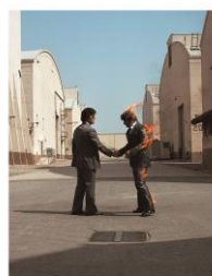
"Wish you were here" album cover © Pink Floyd, image of ltd. Edition prints, designed by Aubrey Powell, Storm Thorgerson [Hipgnosis].