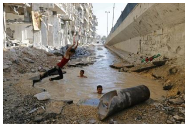
Hosam Katan, Humans at War