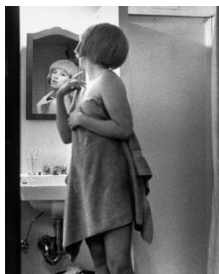
Cindy Sherman, Untitled Film Still #2, 1977, Courtesy of the artist and Metro Pictures, New York