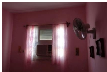
Alexandra Spiegel, Hotel Tropicana, Morón, 2017