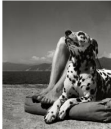
Herbert List, Herr und Hund, Portofino, 1936 © Herbert List Estate, Hamburg / Courtesy: Johanna Breede PHOTOKUNST