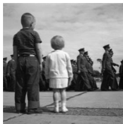
Kinder der Militär-Community Landstuhl bei einer Parade, 1954